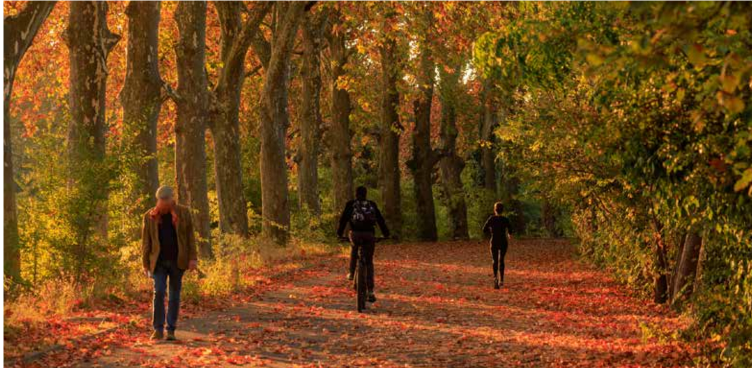
Les déplacements, une des principales cibles du Plan Climat.