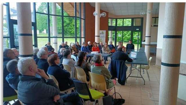
Réunion publique du 29 avril 2024

Il apparaît, à l'analyse de ces sondages, que celui-ci présente de fortes problématiques, notamment en matière de fondations. A l'évidence, celles-ci, quasi inexistantes dans certains points de sondage, ne supporteront pas une évolution du bâtiment telle que prévue à l'origine.