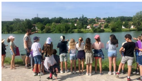
Figure 55 Animations auprès des scolaires