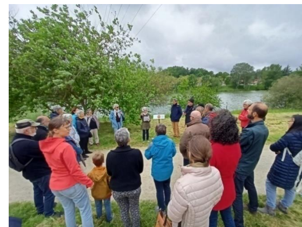
Figure 54. Lectures contées lors de la fête de la nature 2023