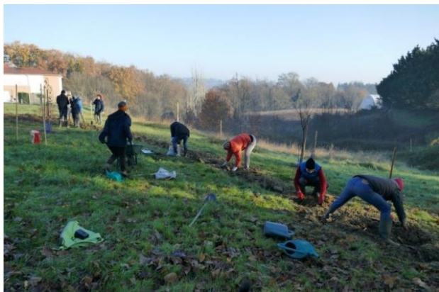
Figure 50. Chantier participatif, plantation d'une haie