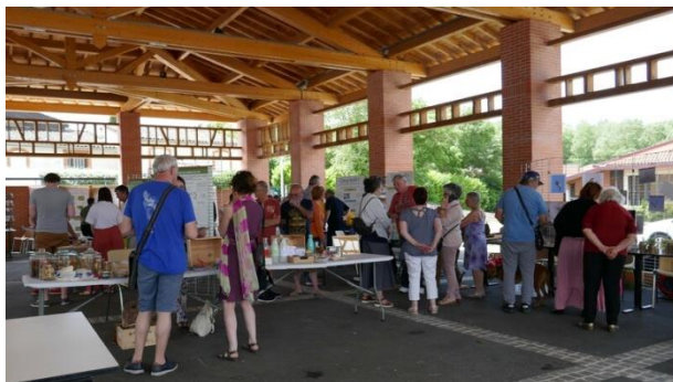
Figure 53. Fête de la nature 2022 : première fête de la nature de la commune !