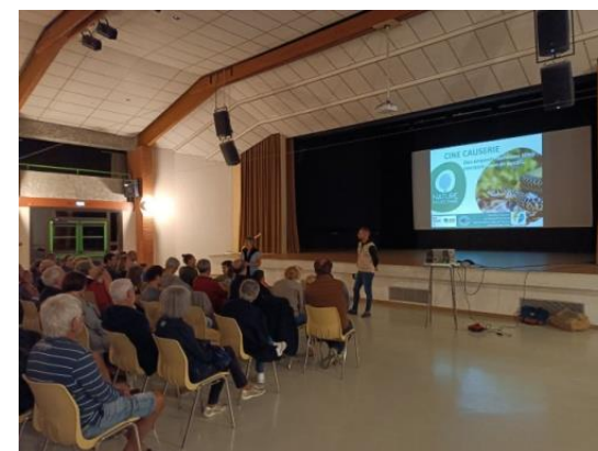
Figure 52. Ciné-causerie sur les serpents, animée par NEO