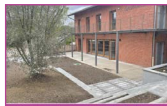
Façade avant et aménagements du jardin