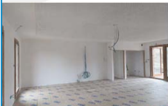
Peinture des murs et pose du sol