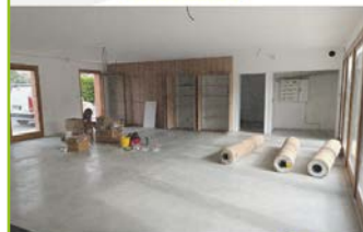
Placards et sol RDC