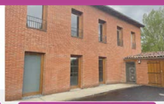
Façade arrière et garages