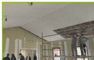
Isolant plafond 1er étage