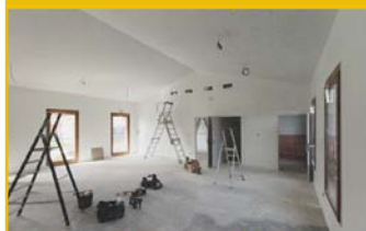
Finitions 1er étage