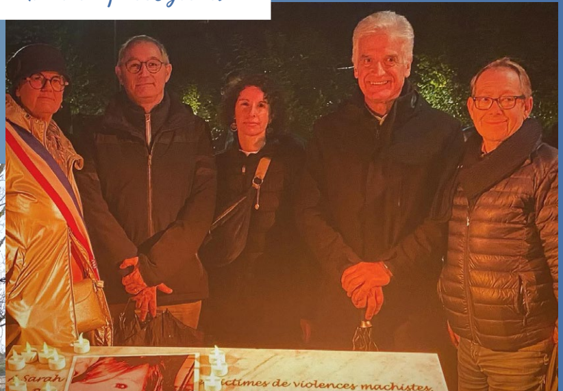
25 novembre 2025 Marche Lutte contre les violences faites aux femmes