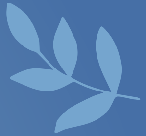
19 novembre 2025 Réunion gouvernance du tiers-lieu (ancien presbytère)