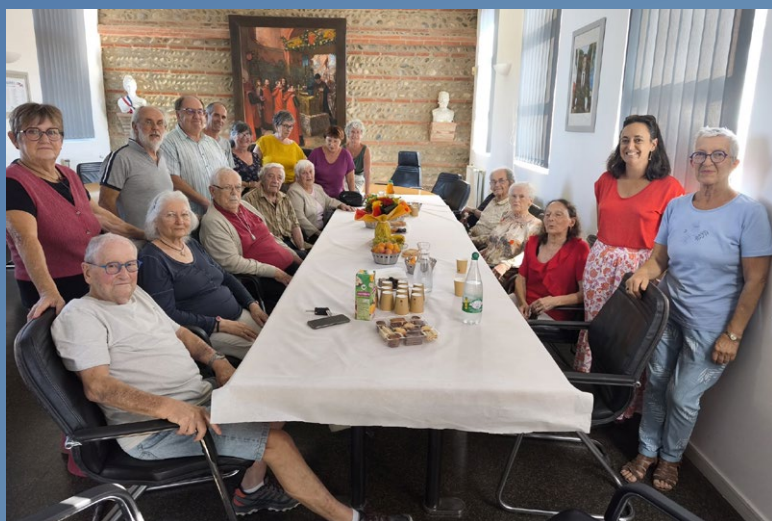
3 septembre 2025 Goûter du CCAS clôture du plan canicule