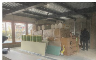
Placo et isolant prêts à être