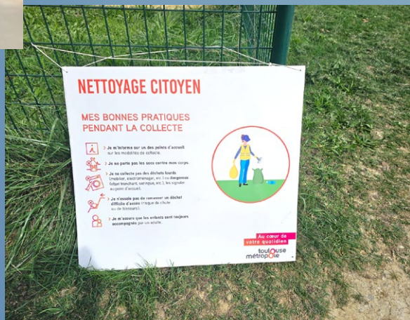
20 septembre 2025 Clean Up Day