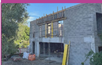
Fin de la maçonnerie