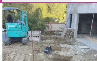
Fondations des supports de la coursive