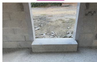
Seuils prêts pour la pose des menuiseries