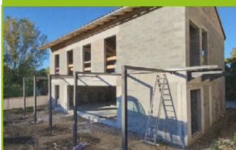
Poteaux de la coursive