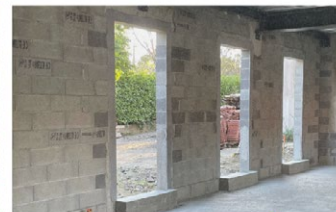
Rez de chaussée