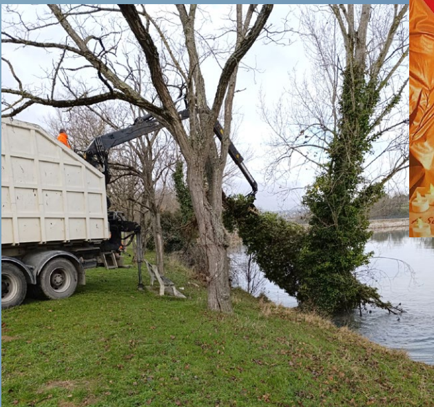
17 décembre 2025 Enlèvement d'arbres tombés dans le lac