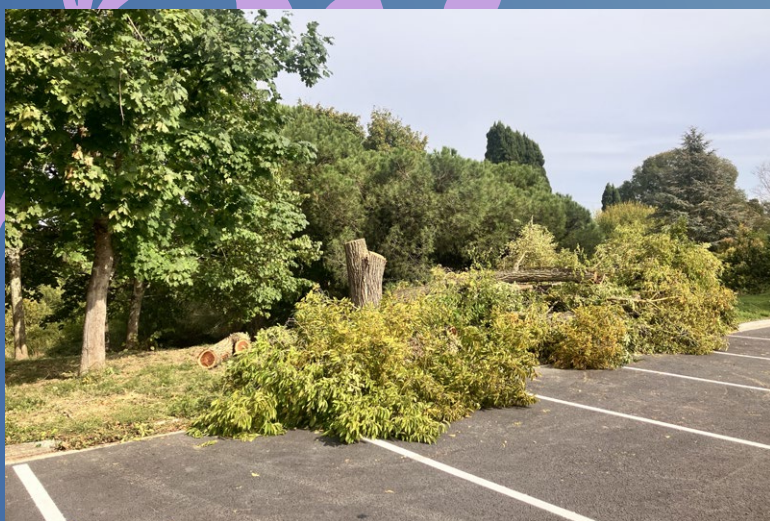
Octobre 2025 Abattage d'arbres dangereux