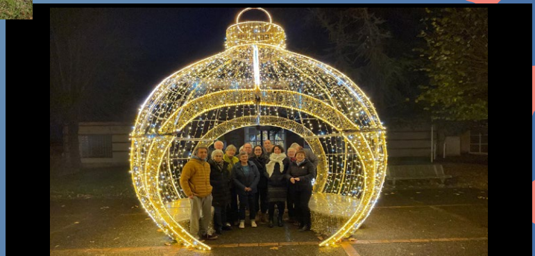
Décembre 2025 Illuminations pour les fêtes de fin d'année