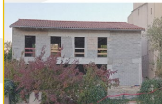
Tuiles de la couverture