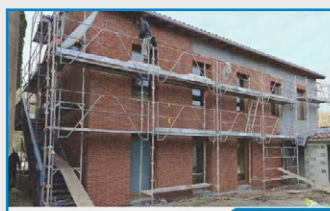
Pose des plaquettes