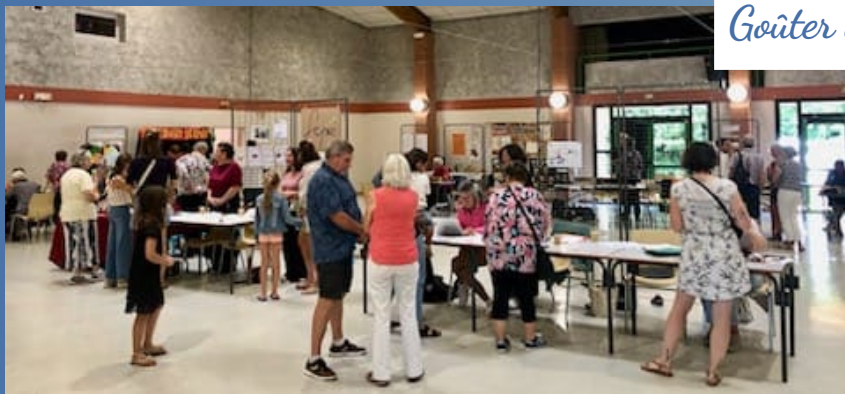
6 septembre 2025 Forum des associations