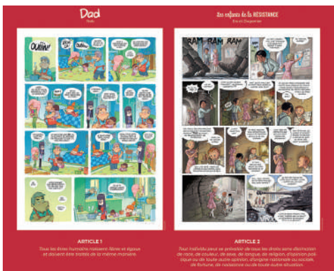
Le fil de l'histoire raconté par Arlène & Nino Erin & Swavia