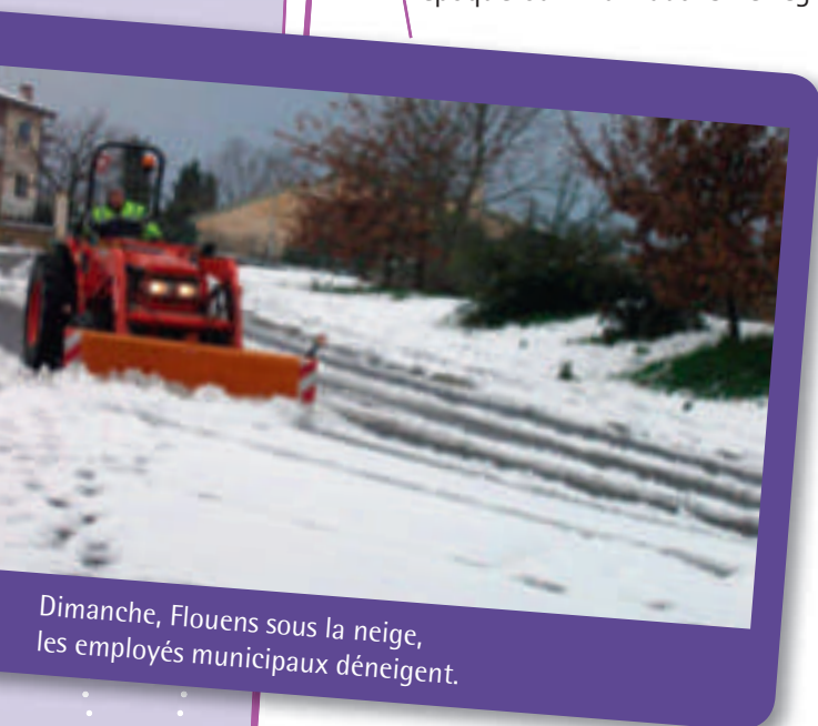
Dimanche, Flourens sous la neige, les employés municipaux déneigent.