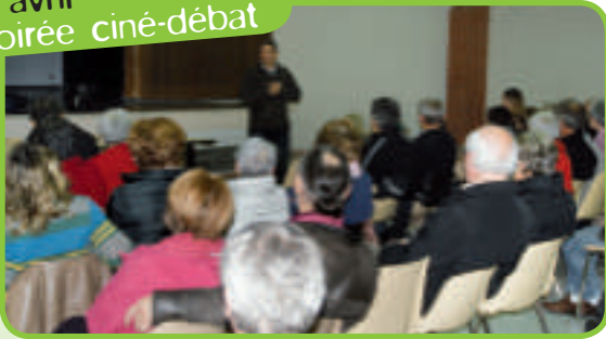
3 avril soirée ciné-débat