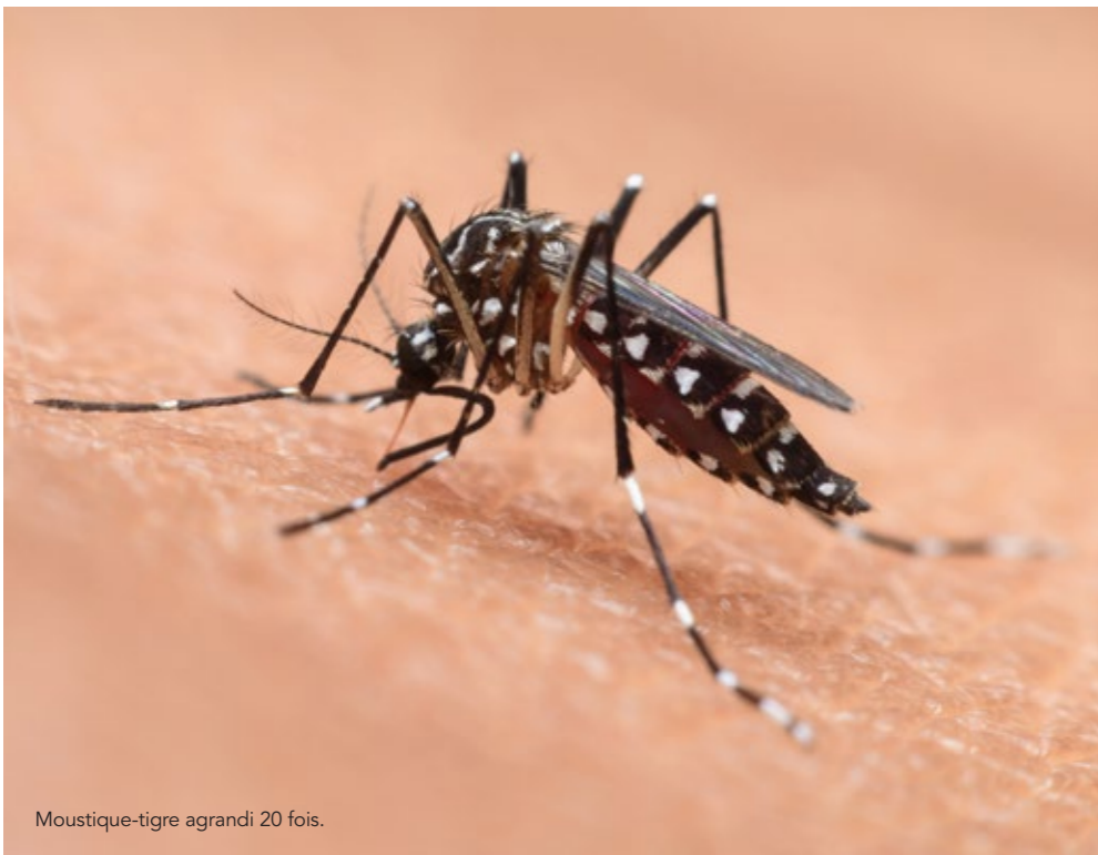
Moustique-tigre agrandi 20 fois.

S'il appartient avant tout à chacun d'adopter le réflexe de supprimer tout gîte larvaire, c'est dans le cas de la déclaration d'une personne malade (laquelle revient d'un pays où elle s'est faite contaminer) que la démoustication par traitement chimique est pratiquée, uniquement sur un espace restreint, autour de son habitation. Ponctuelle et localisée, celle-ci est décidée par le préfet qui en confie la réalisation au Conseil départemental, lequel délègue cette compétence à un opérateur : l'Entente Interdépartementale pour la Démoustication du littoral méditerranéen (EID Méditerranée). Enfin, à grande échelle, cette démoustication n'est pas recommandée car elle aggraverait le phénomène en renforçant l'immunité du moustique-tigre d'une part, et n'a aucun effet ni sur les œufs, ni sur les larves, d'autre part.